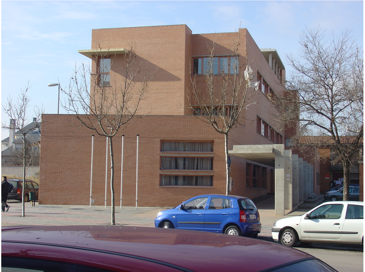
IMAGEN EXTERIOR FIN DE OBRA