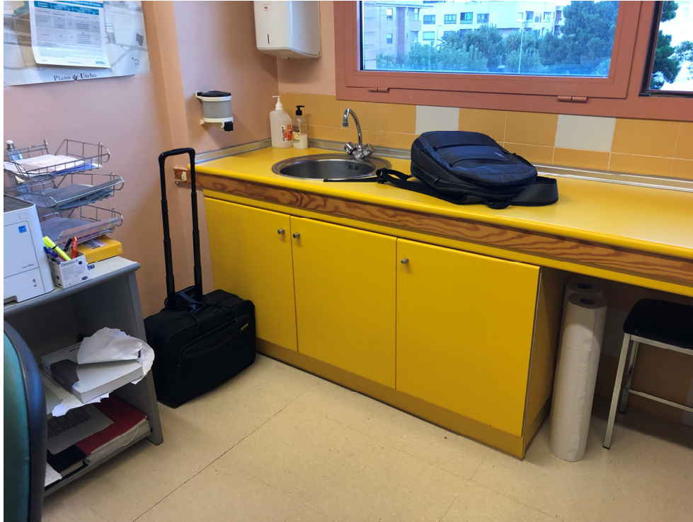
Consulta PB con arqueta estanca